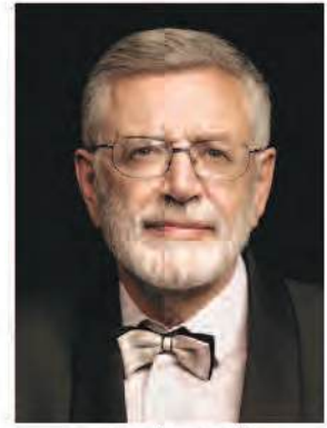
главный дирижёр Борис Нодельман