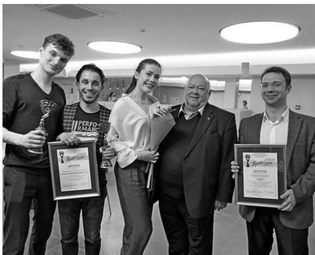
Создатели и участники спектакля «Анри»