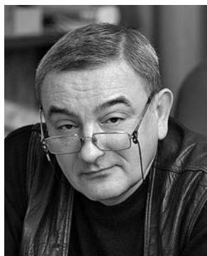
народный артист РФ КИРИЛЛ СТРЕЖНЕВ ГЛАВНЫЙ РЕЖИССЁР ТЕАТРА