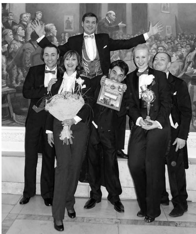
Победители конкурса капустников «Золотая кочерыжка»