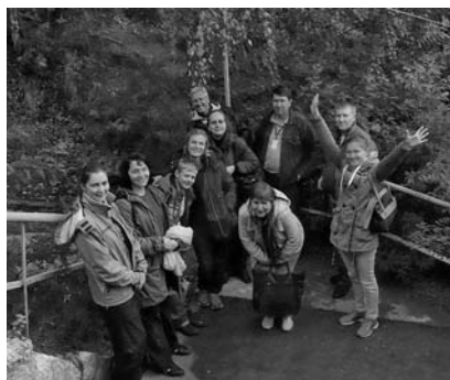
Поездка в Кунгурскую пещеру