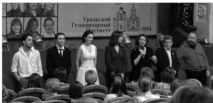
Встреча-диалог со зрителями спектакля «www.силиконовая.дура.net» (Новоуральск)