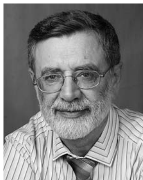
заслуженный деятель искусств РФ БОРИС НОДЕЛЬМАН ГЛАВНЫЙ ДИРИЖЁР ТЕАТРА