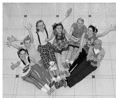
Участники конкурса капустников СО СТД РФ