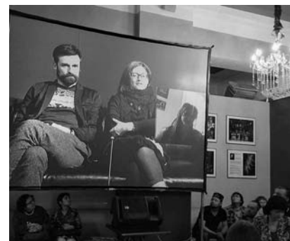
Телемост с создателями спектакля «Анри»