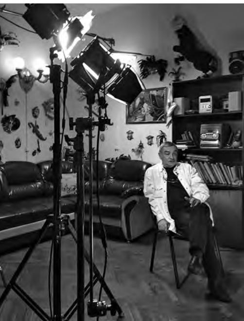
Съемка фильма «Место режиссёра»