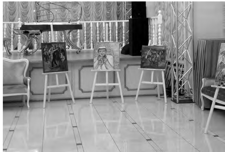
«Настроение – Монмартр!»