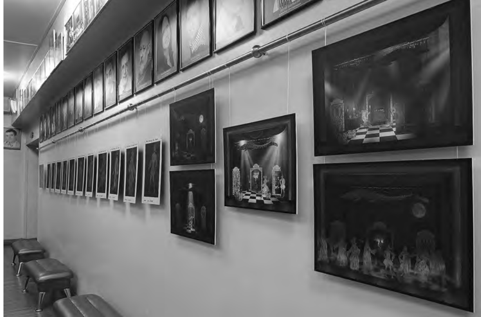
«Для вас, милые дамы...»