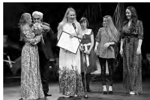
Актёрский ансамбль спектакля «Яма»