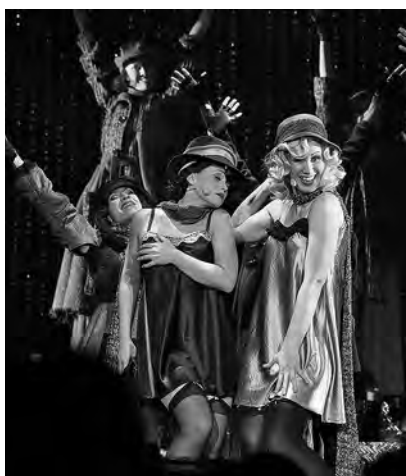
«C'est la vie»