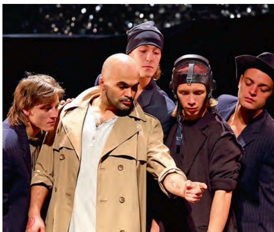
«Грамматика одного движения»