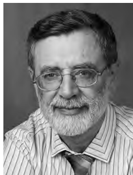
заслуженный деятель искусств РФ БОРИС НОДЕЛЬМАН ГЛАВНЫЙ ДИРИЖЁР ТЕАТРА