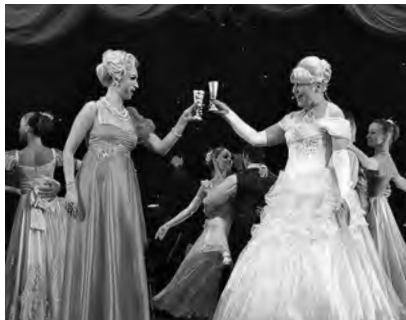
Концерт-дуэт Свердловской музкомедии и Белорусского музыкального театра

VI фестиваль современного танца «НА ГРАНИ – регион».