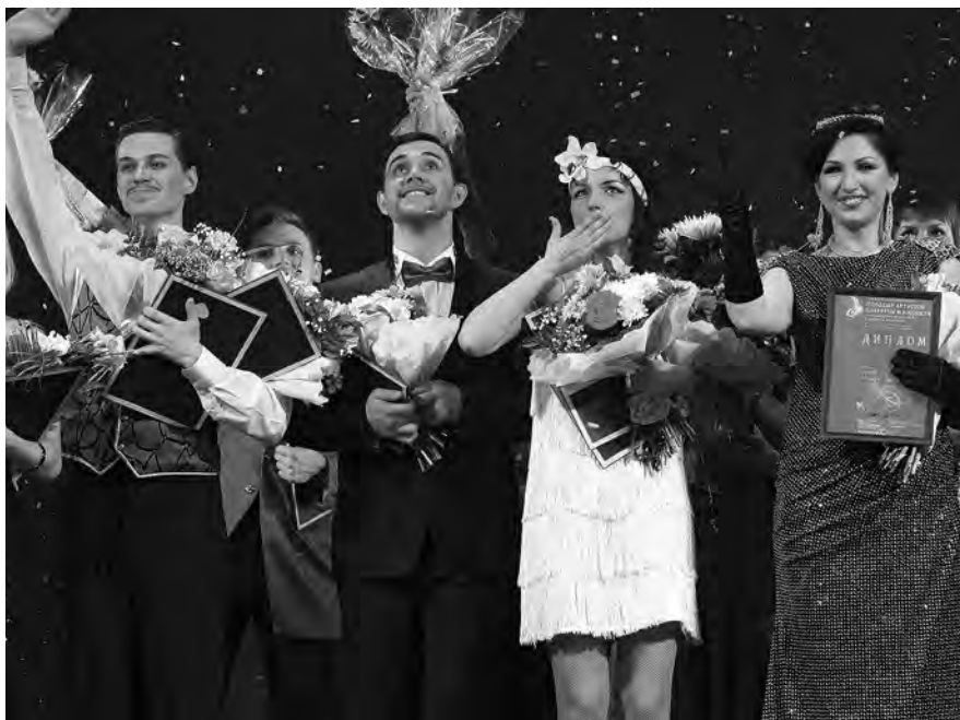
Лауреаты V международного конкурса молодых артистов оперетты и мюзикла им. н.а. СССР В.А. Курочкина