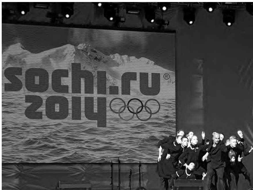
«Эксцентрик-балет Сергея Смирнова» на XXII Зимних Олимпийских Играх в Сочи