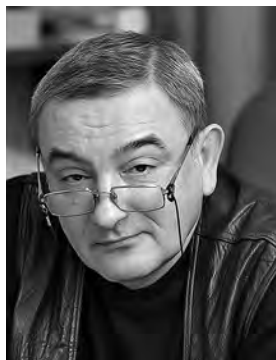
народный артист РФ КИРИЛЛ СТРЕЖНЕВ ГЛАВНЫЙ РЕЖИССЁР ТЕАТРА