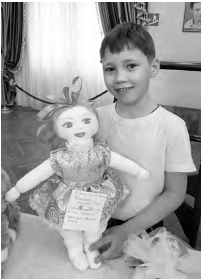
«В гостях у Буратино»