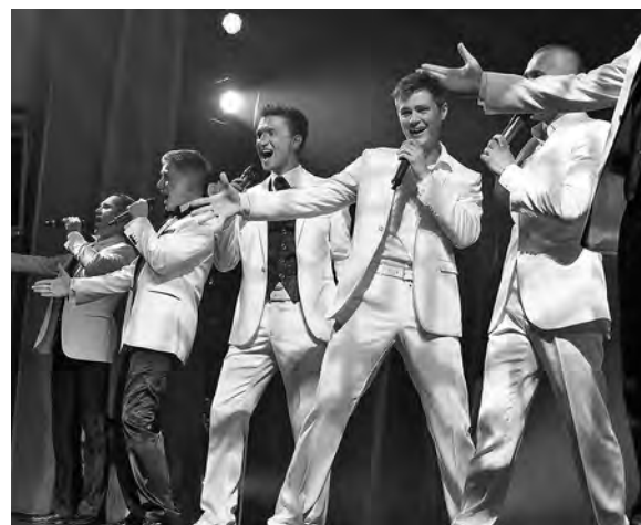
«Соло для NON SOLO»