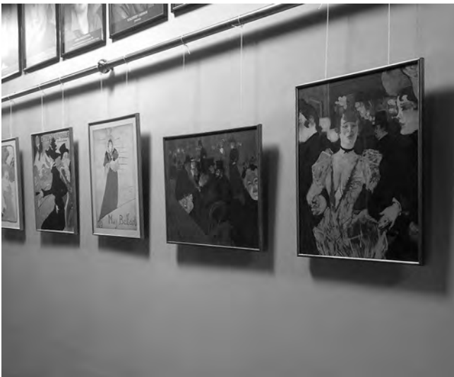
«В ожидании Анри»